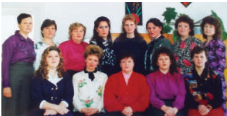
Коллектив детского сада в 90-е годы

А в начале семидесятых годов прошлого столетия был построен новый двухэтажный детский сад. Долгое время в детском саду функционировала и группа с ночным пребыванием детей. В середине семидесятых я начала работать воспитателем, а в начале 80-х – заведующей. В эти годы, после строительства детских садов в близлежащих деревнях, осталось три