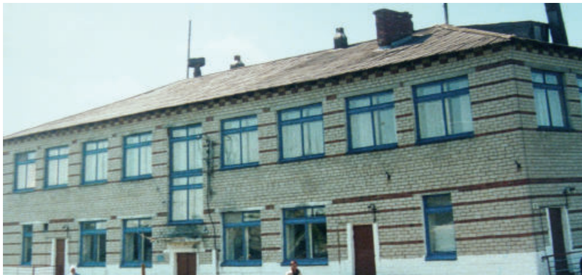
Харловский детский сад 1980-90 гг.

Он несколько раз менял адрес местонахождения – ул. Советская, Береговая (по воспоминаниям жителей), был он и колхозным, и бюджетным, сменялись руководители, но неизменным остается его предназначение: воспитание подрастающего поколения. Располагался детский сад и в частном деревянном доме, и в административном здании.